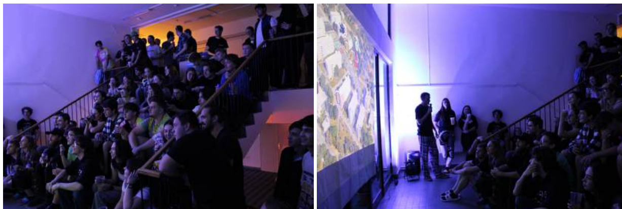
Obrázek 7: Infoschůzka bloku 9

Každoročně očekávaná série večerů infoschůzek se stejně jako každý rok velmi vydařila. Každý blok si připravil program s prezentací o tom jak, se u nich žije. Večery doprovázelo spoustu různorodých aktivit, které si organizátoři na daném bloku připravili. Během nich se noví i stávající obyvatelé jednotlivých bloků mohli setkat a lépe poznat.