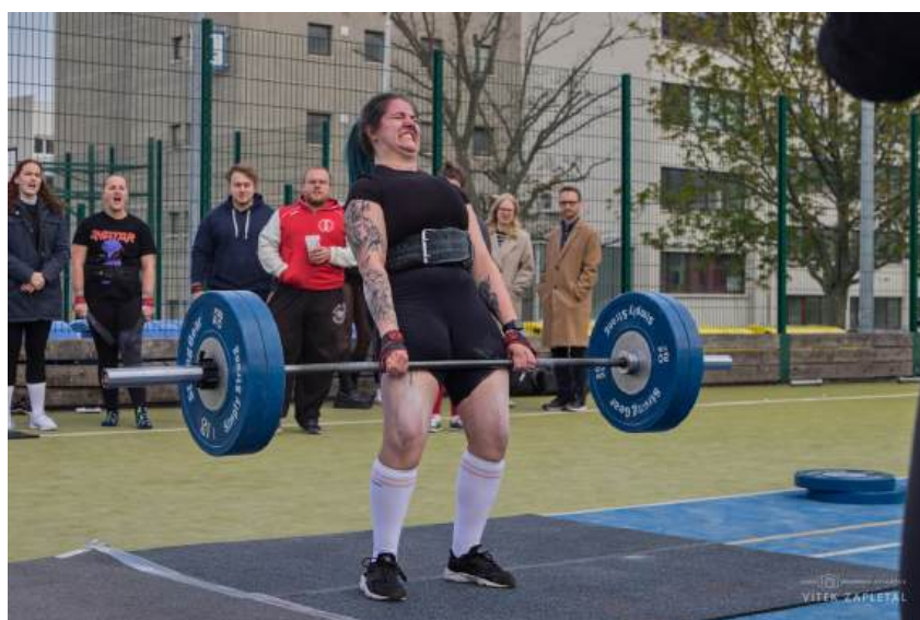
Obrázek 4: Silicon Hill Strongest Man

Silová soutěž Strongest Man testovala sílu a vytrvalost účastníků v několika disciplínách, jako je mrtvý tah, přemístění a výraz jednoručky, nošení kufrů a přenos pytlů s taháním saní.