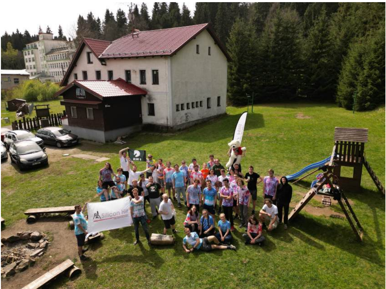
Obrázek 2: Letní výjezdní zasedání

První výjezdko roku proběhlo na chatě Archa v Krušných horách. Opravdu nabitý víkendový program byl nejen o zábavě a táborových hrách, ale proběhla mimo jiné také řádná schůze představenstva.