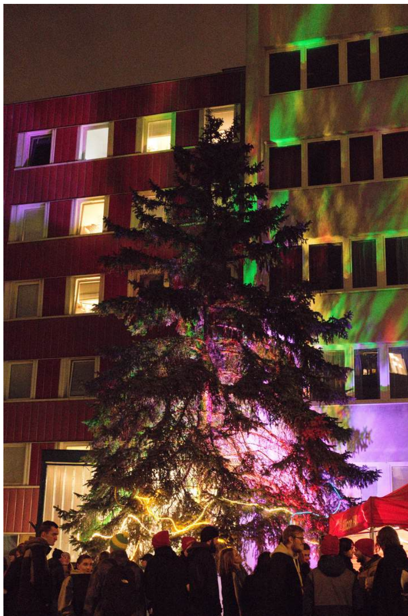
Obrázek 10: Rozsvícení SHtromečku

Aby nás Ježíšek našel i na Strahově, ukázali jsme mu cestu rozsvícením SHtromu vedle bloku 8. Účastnit se mohl každý, a aby ho netrápila zima, mohl se ohřát horkým svařákem a medovinou.