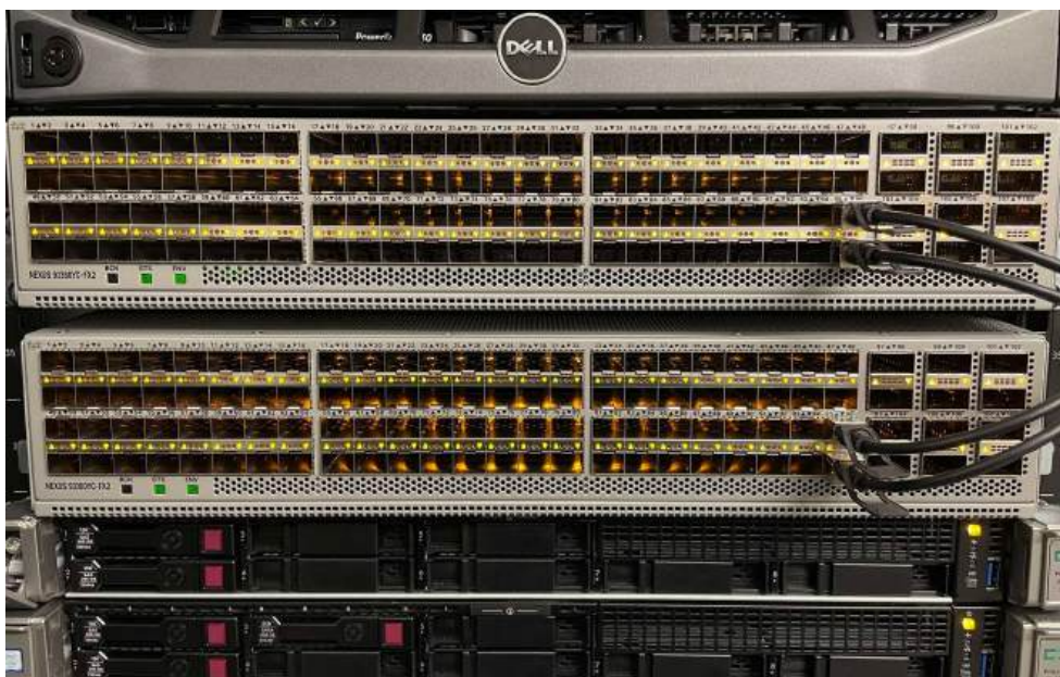
Obrázek 14: Nové Switche

Během roku sekce organizovala odborné víkendové akce zaměřené na technicko-edukační témata. Setkání ve školicím centru poskytla nováčkům cenné zkušenosti v oblasti serverů a sítí, což přispělo k rozvoji komunity a zapojení nových členů.