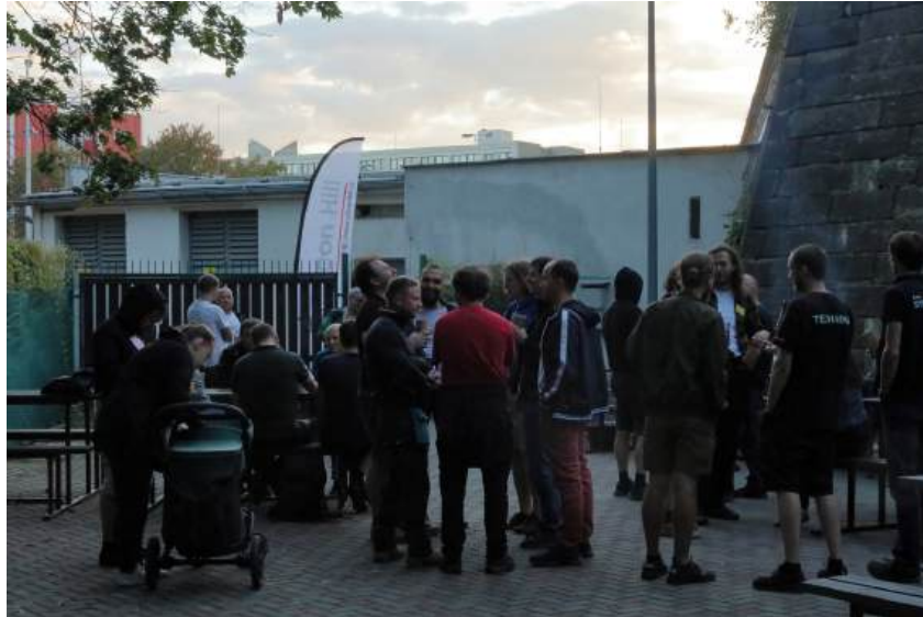
Obrázek 5: Alumni SH

Večer setkání aktuálních aktivních s jejich předchůdci z dob minulých proběhl po tříleté pauze. Účastníci se mohli pobavit o historii i současném směřování klubu. Mnozí z bývalých aktivních také využili možnosti navštívit centrální serverovnu a prostory AVC, kde mohli shlédnout nejnovější přírůstky do inventáře klubu.