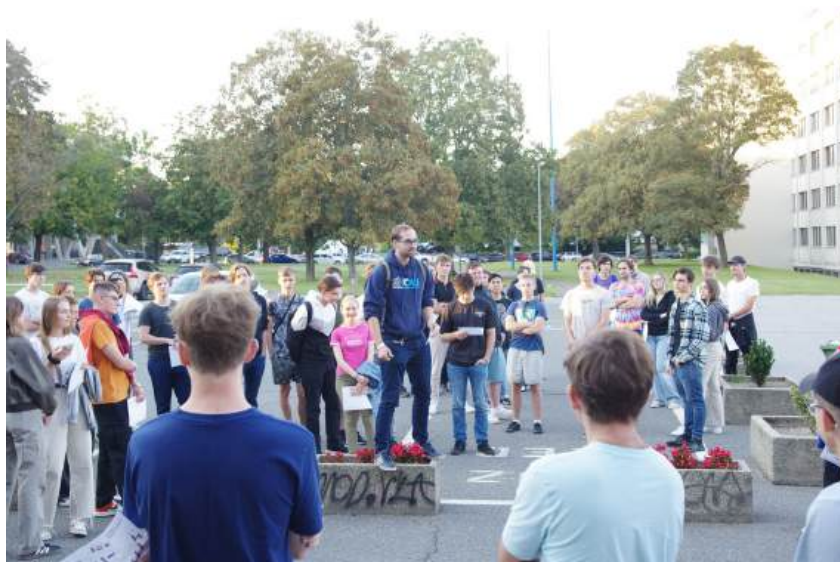
Obrázek 6: Poznej Strahov