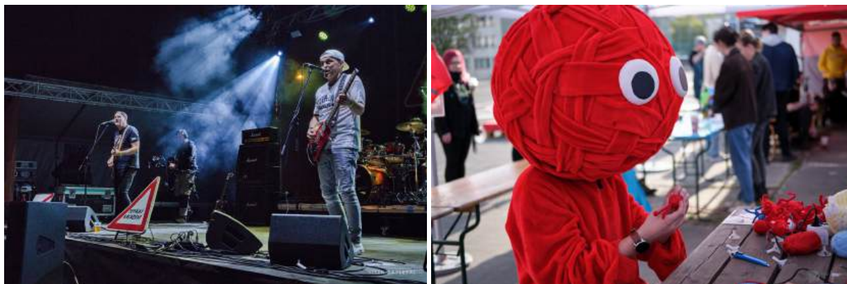
Obrázek 3: SHOW

Náš každoroční středeční (jak už název napovídá) hudební festival má za sebou další úspěšný ročník. Tentokrát se SHOW mohla pochlubit návratem třetí stage v prostorách Klubu 007. Celkem v rámci programu festivalu zahrálo 14 převážně studentských kapel; jako hlavní hřeb večera si účastníci mohli poslechnout slavnou kapelu Totalní Nasazení. Festival nabízel i pestrou škálu doprovodných programů: sportovní sekce uspořádala tradiční silovou soutěž Silicon Hill Strongest Man a na stánku Silicon Hill si účastníci mohli batikovat trička s logem klubu a vyrobit si vlastního Strahováčka.