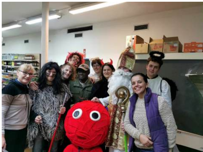
Obrázek 11: MikulaSH

Mikuláš letos nevynechal ani aktivní členy klubu. Ti poslušní byli odměněni nemalým množstvím sladkého, zatímco zlobiví byli předhozeni čertům.