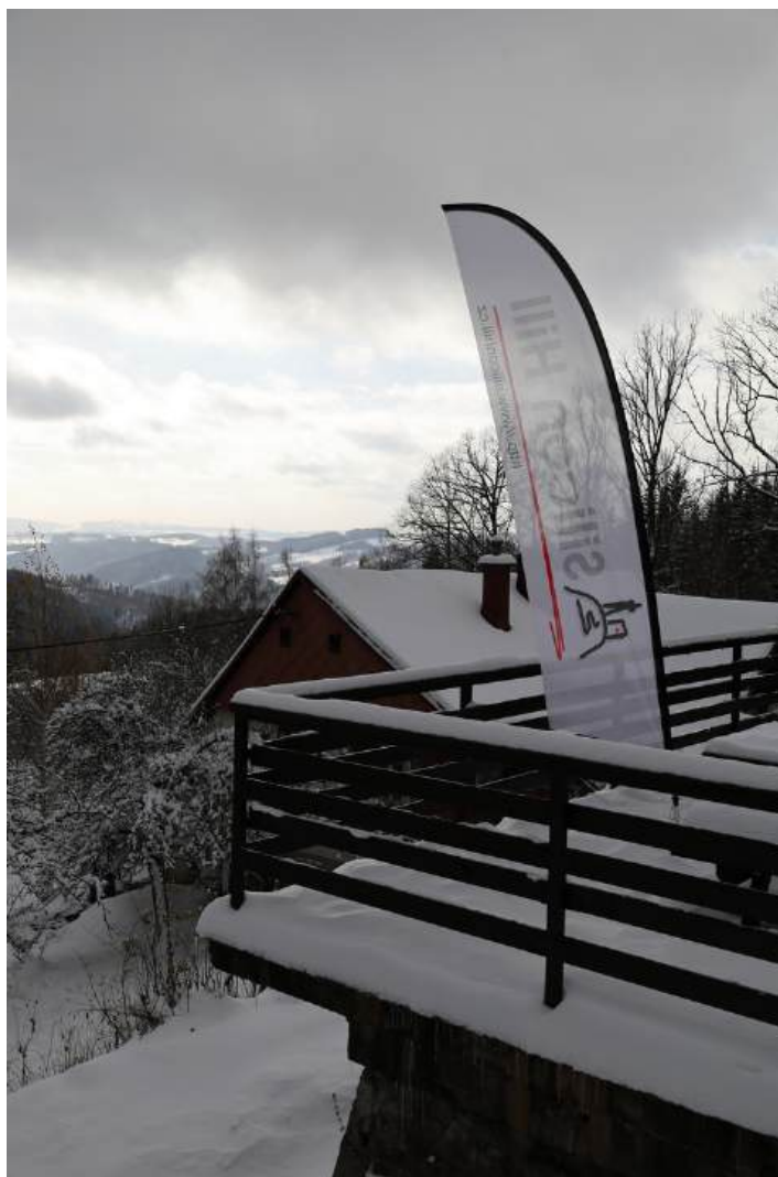
Obrázek 9: Zimní výjezdní zasedání

Na podzim proběhlo druhé výjezdní zasedání roku, pro úspěch předchozího roku opět na chatě Bratrouchov. Cesta do podhůří Krkonoš byla kvůli nekompromisní listopadové sněhové kalamitě náročná, jak již bylo očekáváno a nikdo se nenechal sněhovou nadílkou překvapit. Program byl v porovnání s předchozím výjezdkem méně nabitý, což poskytlo větší prostor na vzájemné seznámení účastníků zasedání. Pro neočekávaně dlouhé oficiální zasedání představenstva se přesto některé plánované aktivity nestihly.