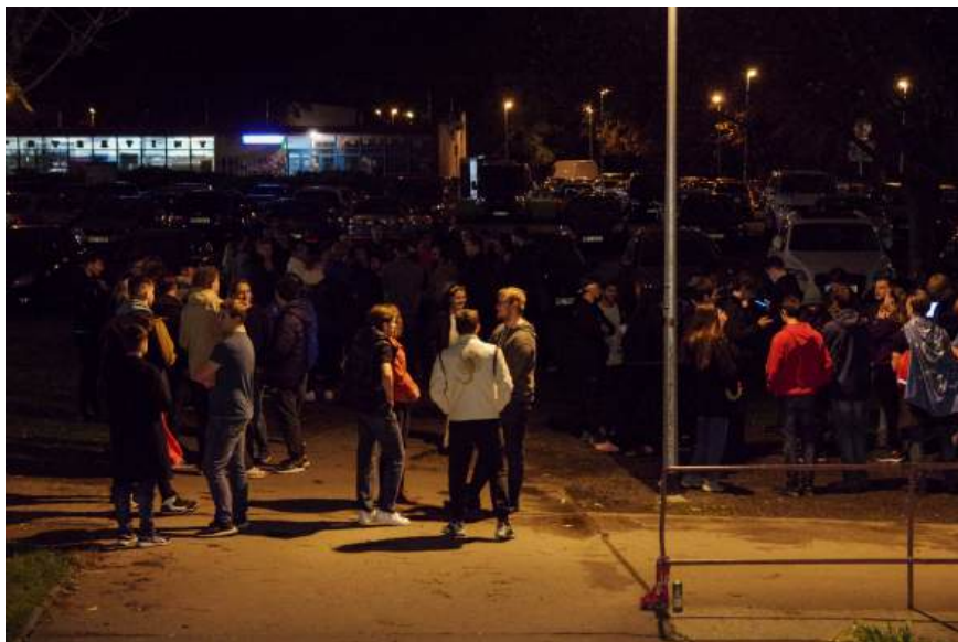
Obrázek 8: Blokové hry ZS2024

Série čtyř večerních her s cílem pobavit a ucelit osazenstvo bloků tentokrát probíhala na téma "Společenstvo křemíkové hory". Vítězem se stal blok 2 s 35 body, druhý blok 3 prohrál o pouhý jeden bod. Závěrečná bloková hra, spojená s malým pohoštěním a slavnostním předáním cen, proběhla jako vždy v prostorách Školického centra.