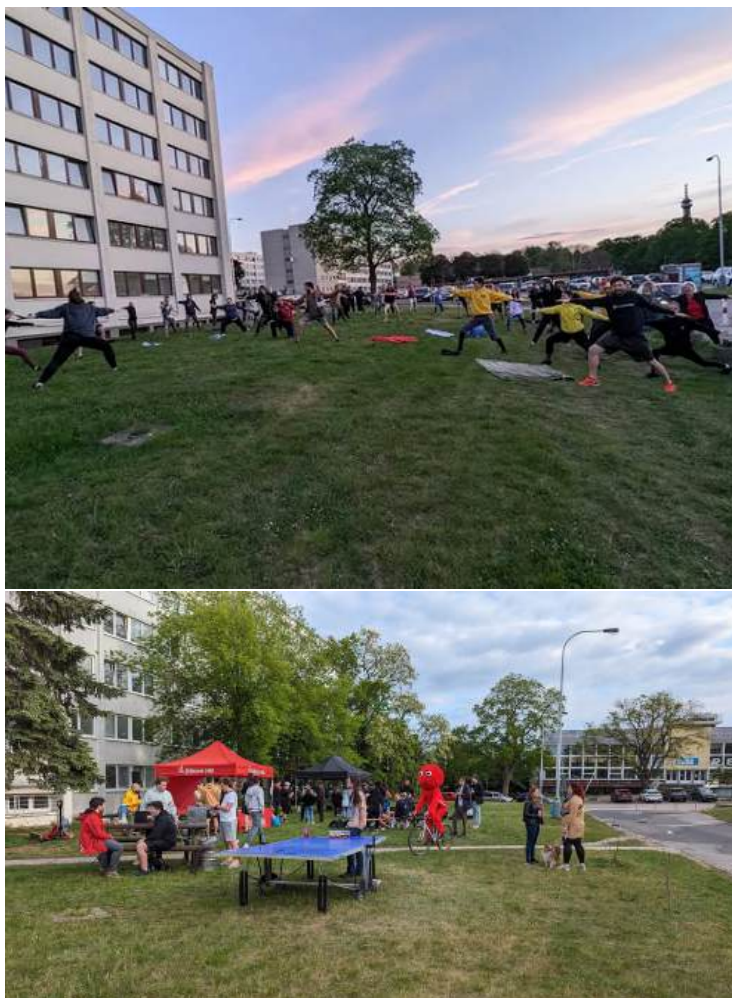
Obrázek 1: Blokové hry LS2024 a oslava narozenin klubu

Blokové hry letního semestru spojovalo hlavní téma "Vesmírná odysea". Celkem proběhlo pět her a závěrečné minihry konajících se společně s oslavou 26. narozenin klubu. Pro výhru bylo nutné se účastnit i dvou bonusových her: cestováním s blokovým maskotem (a jeho případné vytvoření), a ranní jógy. Poslední roky pozorujeme vzrůstající zájem o účast ve hrách. Výhercem her se suverénně stal blok 3 se svými 71 body s náskokem 8 bodů na v pořadí druhý blok 9.