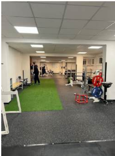
Obrázek 13: Stavební rekonstrukce velké posilovny