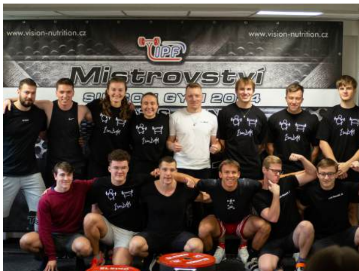
Obrázek 12: Silicon Hill SQUAT & BENCH

Již 4. ročník soutěže Silicon Hill SQUAT & BENCH proběhl v čerstvě rozšířené části fitcentra na bloku 2. Dříve nastavený vysoký standard soutěže byl letos obohacen o profesionálního komentátora, který doprovázel i mistrovství ČR federace ČSST. Celkově se soutěže zúčastnilo 15 závodníků, přičemž ti nejlepší z nich si odnesli věcné ceny.